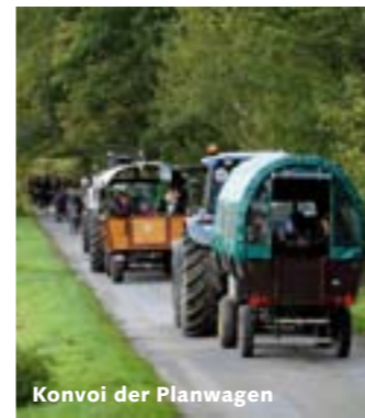
Konvoi der Planwagen

Für die Zuschauer/innen der diesjährigen Schleppjagd werden wieder überdachte Planwagen angeboten, mit denen sie an die interessantesten Stellen der Schleppjagd gefahren werden. Es ist somit auch