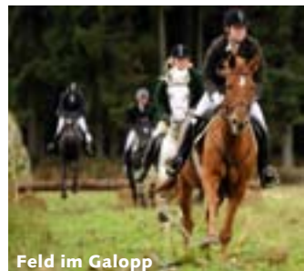
Feld im Galopp