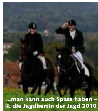
...man kann auch Spass haben – li. die Jagdherrin der Jagd 2010