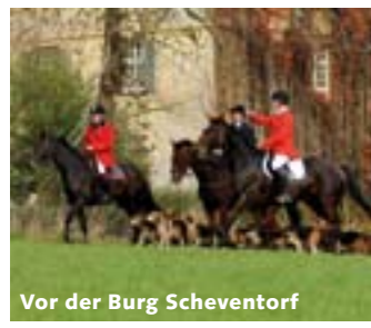
Vor der Burg Scheventorf