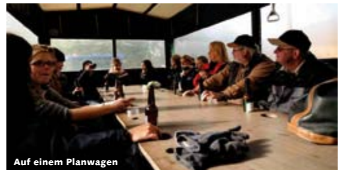
Auf einem Planwagen