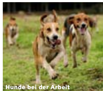
Hunde bei der Arbeit